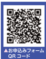
▲お申込みフォーム QRコード

本チラシ下部に必要事項をご記載の上、送信ください。 FAXでの申込みは、FAX受信が可能な方に限らせていただきます。 (受付票を返信いたします)